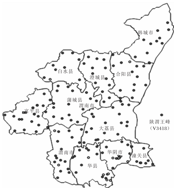
图1 渭南市区域站原始报文站点信息标注时发现的明显错误

例如区域站的站址、所在行政地区，与经度、纬度、海拔高度等地理信息不对应。如图1所示，将渭南市全市的区域站按原始上传报文中的经纬度信息标注在地理信息系统时，出现了明显的奇异点。业务管理部门上报的站点信息中，应属于韩城市辖区的陕渭王峰(V3418)站的位置出现明显偏差。这类错误导致该站数据不可信，对绘制等值线图、色斑图进行数据插值时造成影响。